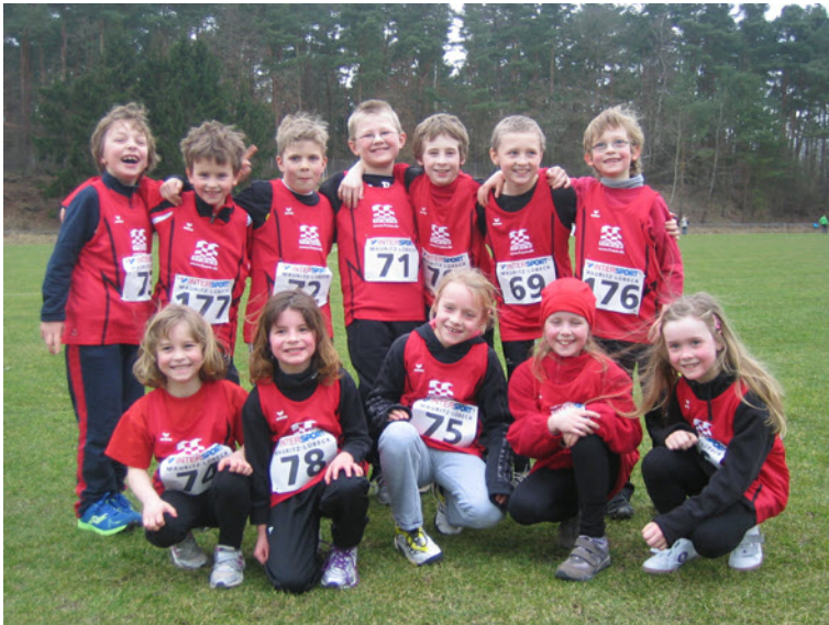
Teilnehmer Crosslauf 2012